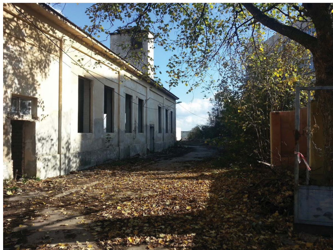
Snímek jatek z roku 2014.

to byli především vy, kdo nedržel smluvní závazky a nezahájil včas výstavbu.